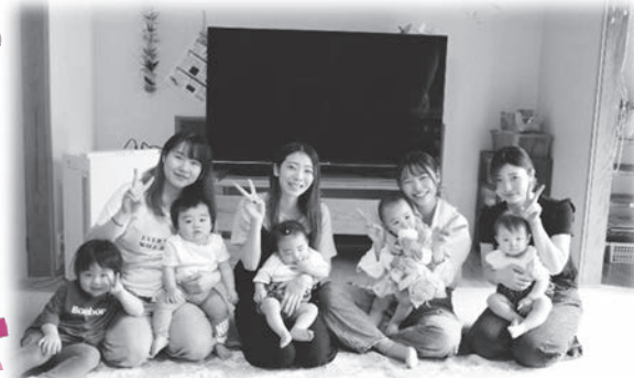
お母さんと一緒にハイ！ピース(^^)♪