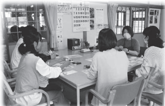
銀のスプーンを作りました♪